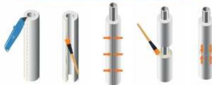
Изоляция смонтированных трубопроводов

Паспорт разработан в соответствии с требованиями ГОСТ 2.601-2019